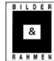
GERHARD FRÖHLICH http://www.rahmen.cc/index.htm

Copyright 2005 Gerald Pechoc All rights reserved